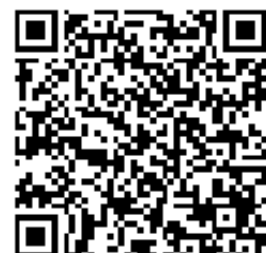
QR-Code zum Produkt